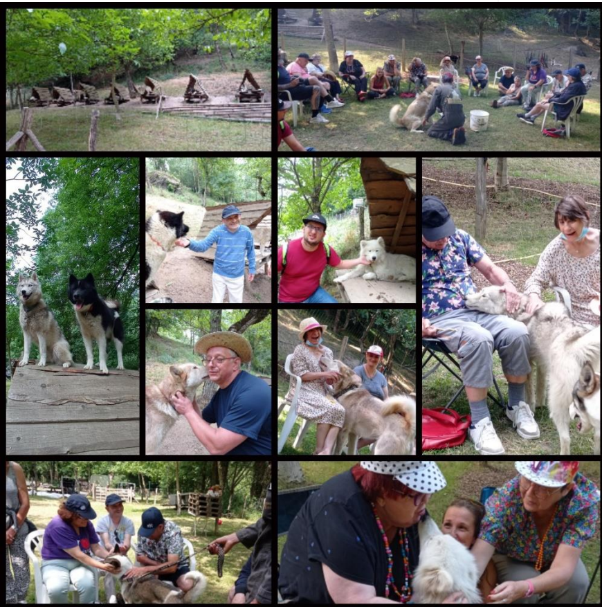
Le repaire des huskys

Rythmé par quelques activités comme un petit plouf à la thalassothérapie, pleins de câlins grâce à la rencontre d'une meute de huskys, se faire plaisir en faisant du shopping, réveiller ses papilles au restaurant et se défouler au bal dansant du village.