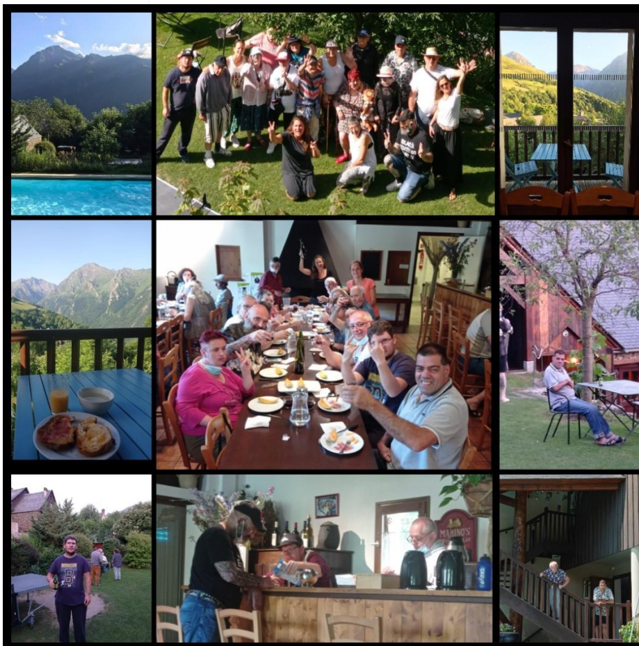
La vie au gites

Bref, nous avons profité à fond et quel bonheur de retrouver un semblant de vie normal, malgré la conjoncture actuelle.